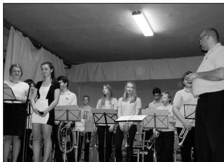
Ve čtvrtek 11. prosince 2014 jsme měli možnost si poslechnout Předvánoční koncert Malého dechového orchestru ZUŠ Kojetín