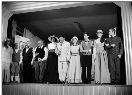
V pátek 14. listopadu 2014 zahrál v Křenovicích Divadelní spolek Na štaci z Němčic nad Hanou divadelní hru Charleyova teta