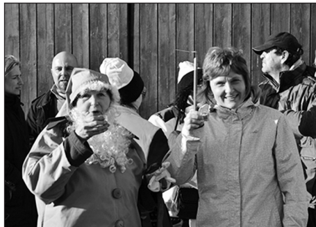
V sobotu 14. února 2015 proběhlo ulicemi Křenovic Vodění medvěda