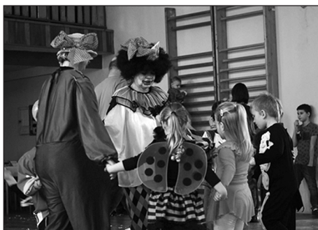
V neděli 15. února 2015 se do místního Kulturního domu sešly převážně děti a vydováděly se na Dětském karnevalu