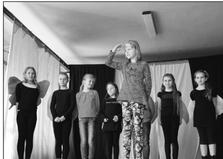
V úterý 7. dubna 2015 vystoupily děti ze ZŠ a MŠ Křenovice v místním kulturním domě na Setkání seniorů