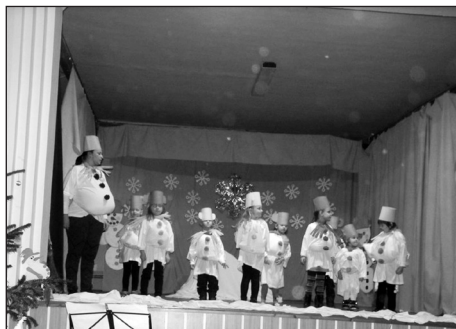
V úterý 16. prosince 2014 si připravila naše škola a školka velmi pěkné vystoupení na Předvánoční besídce